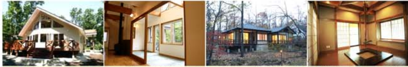
大屋根による明るい吹抜 ベットも一緒にサンルーム 落ち着いた和風造りも 火を囲んだ静かな時間と

黒磯インターチェンジ 東北道黒磯SA周辺では、平成二十年度内開設の予定で「黒磯IC」新設の諸整備工事が行われています。 IC出入口にある東那須工業団地敷地には、二・五畝の店舗面積「那須ガーデンプラザ」が今年開業予定。 那須塩原駅近くの大原間地区では、「イオンタウン(仮称)」の進出、那須塩原警察署新庁舎移転などが決まっています。 黒磯ICの開通を期に、自然と温泉の恵み豊かな地区と、新たに出現したモダンな商業地区を含む、広域