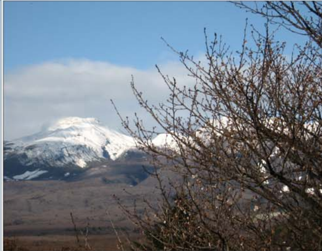
千振の四季桜と那須岳 (H18年初冬)

お問い合わせ・お申し込みは、社団法人 那須観光協会(湯本 Tel.0287-76-2619) 広谷地の友愛の森でもテキストを販売中